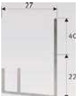
DF1, DF2, DF3